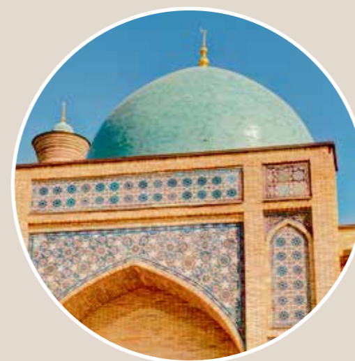
In der historischen Altstadt von Tashkent findet sich das faszinierende Architektur-Ensemble Hazrat Imam.