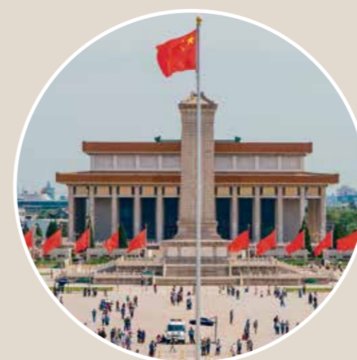
Der Tian'anmen-Platz, auch Platz des Himmlischen Friedens genannt, im Zentrum von Beijing