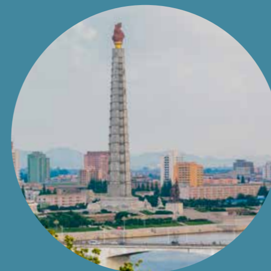
Chuch'e-Turm in Pjöngjang an der Uferpromenade des Taedong-gang.

Die CONSUL Reise „Ostasiatische Wunderwelten“ bietet Ihnen die Möglichkeit, an einem zweitägigen Trip nach Nordkorea teilzunehmen. Dies ist optional. Alternativ können Sie sich für unser exklusives Programm in Beijing entscheiden. Die Tour nach Nordkorea inklusive aller dort angebotenen Leistungen ist ohne Aufpreis möglich. Der CONSUL Privatjet kann nicht in Nordkorea landen, so dass wir auf dieser Teilstrecke mit Linienflügen unterwegs sein werden.