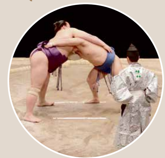
Sumo ist ein Ringer-Wettbewerb aus der Heian-Zeit.