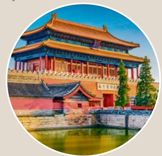
Verbotene Stadt: Hier regierten bis 1911 die chinesischen Kaiser.