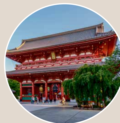
Der berühmte Sensoji-Tempel ist der älteste buddhistische Tempel Tokios.