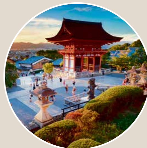
Die einstige japanische Hauptstadt Kyoto zeigt zahlreiche Tempel, Schreine und Paläste.