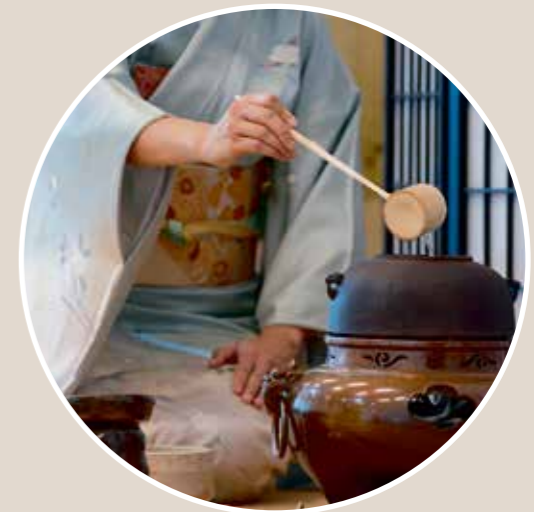
Das japanische Tee-Ritual basiert auf der Zen-Philosophie.