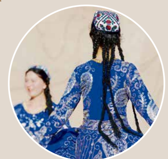
Musik und traditionelle Tänze lassen Sie in die usbekische Kultur eintauchen.